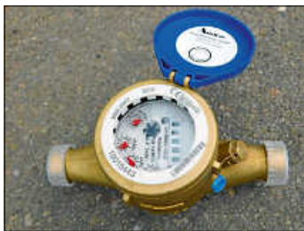
Foto: Gemeinde laut § 17 Abs. 1 der Wasserversorgungssatzung der Gemeinde Gärtringen vom Gebäudeeigentümer zu tragen. Bei Rückfragen hierzu stehen wir gerne zur Verfügung.

Der Austausch des Wasserzählers ist kostenfrei. Evtl. notwendige Reparaturarbeiten, die den Einbau des Wasserzählers gewährleisten, sind