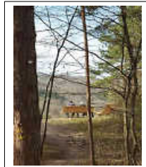
Aussichtspunkt mit Wellenbank