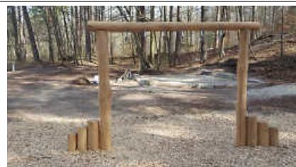
Hangelstrecke und Sandspielfläche

Einen ganz besonderen Dank gilt Uwe Kimmerle, der die Kletterwand, Klettergriffe und die Slackline-Poller auf dem Waldspielplatz Rohrau gespendet hat!