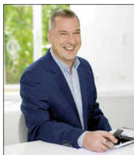
OV Torsten Widmann

Wegen des Gebots der Einschränkung der sozialen Kontakte aufgrund der Corona-Pandemie findet die Sprechstunde diesmal telefonisch statt.