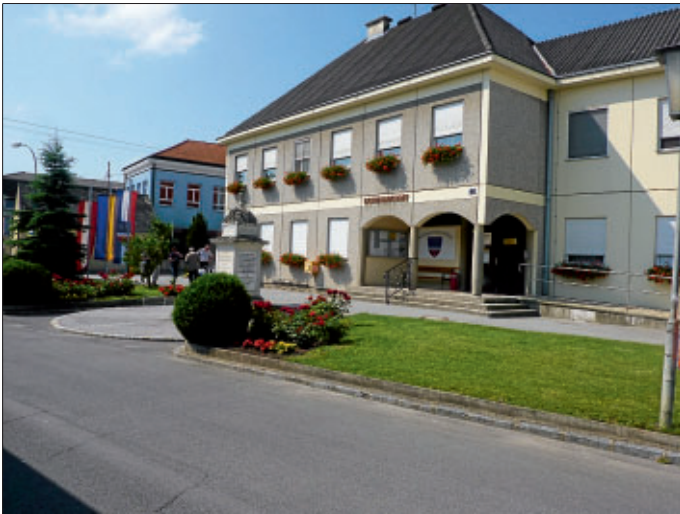
Gemeindeamt Rohrau/Niederösterreich mit Haydn-Denkmal

40-jähriges Jubiläum der Partnerschaft zwischen den Sportvereinen SV Rohrau und SC Rohrau-Gerhaus/Niederösterreich