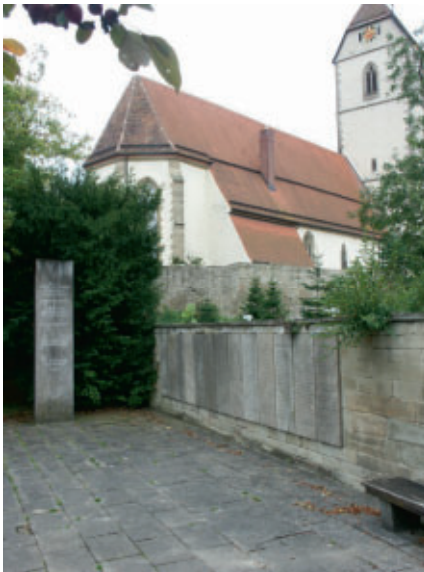
Ehrenmal in Gärtringen

Am kommenden Sonntag ist Volkstrauertag. In Gedenkfeiern gedenken wir der Opfer von Krieg und Gewaltherrschaft und bitten um Verständnis und Versöhnung untereinander.