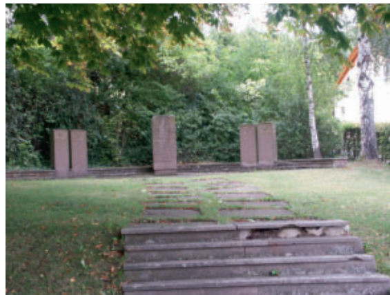
Ehrenmal in Rohrau

Die Feier findet in Rohrau am Sonntag, den 13. November 2011 gegen 11.00 Uhr beim Mahnmal neben dem Friedhof statt.