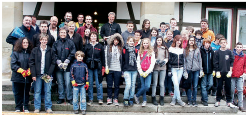
"Klassenfoto" der Klasse 7 der Realschule zusammen mit weiteren fleißigen Helfern aus der Bürgerschaft sowie der 1. Narrenzunft Gärtringen e.V. vor dem Rathaus; auf dem Bild noch nicht festgehalten ist die 7. Klasse der Ludwig-Uhland-Schule

Für die Jugend und Kinder hat die Ortsputzete zweifelsohne auch einen wichtigen erzieherischen Effekt ! Denn eines ist sicher: diejenigen, die geholfen haben, überlegen es sich künftig sicher zweimal, bevor sie etwas achtlos wegwerfen. Außerdem sind sie in der einen oder anderen Situation mit Sicherheit auch Multiplikatoren bei ihren Mitschülerinnen und Mitschülern.