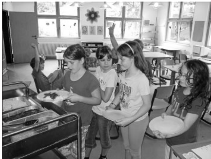
Essen in der Ferienbetreuung