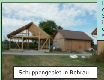
Schuppengebiet in Rohrau

Bei der Gestaltung der Außenanlagen befindet sich das Bauvorhaben der KWE an der Ecke Allmandstraße/ Hauptstraße/ Goethestraße. Auch diese Bebauung sorgt für eine Aufwertung an der viel befahrenen Ortsdurchfahrt sowie der rückwärtigen Flächen.