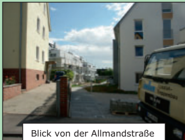
Blick von der Allmandstraße

Um die Bahnhofstraße auch städtebaulich aufzuwerten, werden auf der Nordseite neue Einfriedigungen in Form einer Natursteinmauer erstellt. Grundlage für diese Straßenraumgestaltungsmaßnahme waren umfangreiche Beratungen im Technischen Ausschuss sowie im Gemeinderat. Auch den Anwohnern an der Bahnhofstraße möchten wir für das Verständnis angesichts der erheblichen Beeinträchtigungen durch die Baumaßnahme danken.