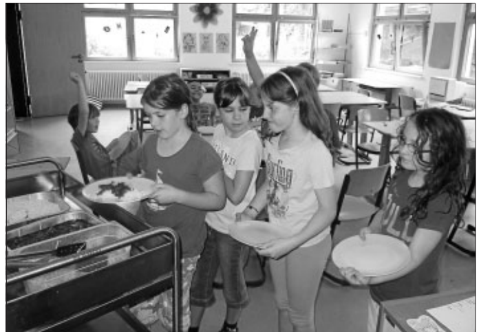
Essen in der Ferienbetreuung