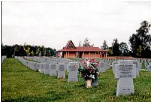
Kriegsgräberstätte in Saldus / Lettland, hier ruhen 2 Gefallene aus Gärtringen.

In vielen Orten und Ländern mahnen Kriegsgräberstätten gegen Krieg und Vergessen. Der Volksbund Deutsche Kriegsgräberfürsorge hat es sich unter anderem zur Aufgabe gemacht, diese Mahnmale zu errichten und zu pflegen.