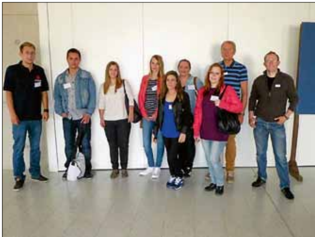
Foto vom Informationsbesuch in der Ludwig-Uhland-Schule v.l.n.r.:

Eine Ausbildung bietet gerade in heutiger Zeit jungen Menschen sehr gute Perspektiven. Vor Ferienbeginn hatten zehn Auszubildende aus sieben Gärtringer Unternehmen die Neuner-Klassen der Ludwig-Uhland-Schule und der Theodor-Heuss-Realschule als Berufsbotschafter besucht. Hierdurch ermöglichten sie den Schüler/innen einen authentischen Einblick in verschiedene interessante Ausbildungsberufe.