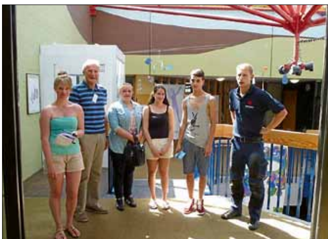
Foto vom Informationsbesuch in der Theodor-Heuss-Realschule v.l.n.r.: