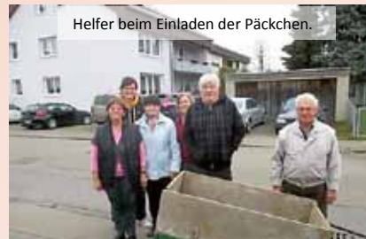
Helfer beim Einladen der Päckchen.

Wir von den Sammelstellen können nur staunen. Trotz der vielen Möglichkeiten zu helfen, haben Sie sich für „Ein Päckchen Liebe schenken“ entschieden.