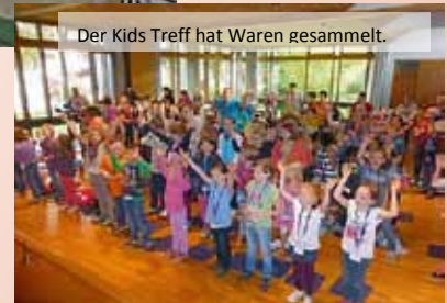
Der Kids Treff hat Waren gesammelt.

Wir danken von Herzen ALLEN Gärtringern und Rohrauern, auch im Namen des Missionsbundes Licht im Osten für die Abgabe der vielen Waren, für die vielen Ideen in den 459 Päckchen , für die gespendeten € 1.398,- und die vielen Gebete . Gott beschenke und segne Sie reich.