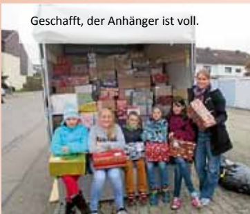
Geschafft, der Anhänger ist voll.