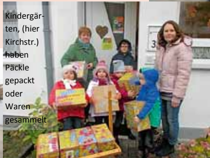
Kindergärten, (hier Kirchstr.) haben Päckle gepackt oder Waren gesammelt