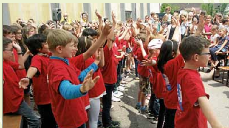
Begrüßung durch den gemeinsamen Schulchor der Ludwig-Uhland-Schule und der Theodor-Heuss-Realschule

Die Tour rollte in diesem Jahr durch die Landkreise Böblingen und Tübingen und wurde landauf-landab sehr herzlich empfangen und konnte durch das Engagement vieler Radlerinnen und Radler sowie vieler engagierter Menschen in der Region Gutes tun für kranke Kinder.