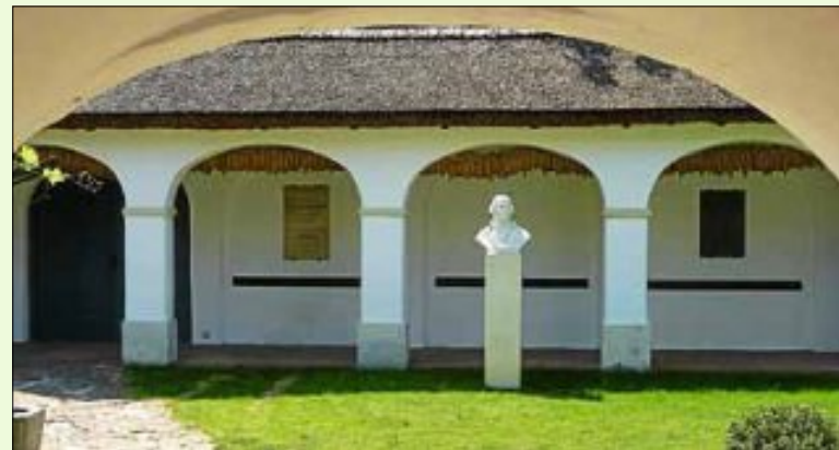
Innenhof des Joseph-Haydn-Geburtshauses in Rohrau/Niederösterreich

Alle Mitbürgerinnen und Mitbürger aus Gärtringen und Rohrau sind zur Mitfeier herzlich eingeladen. Nutzen Sie die Chance mit den Freunden aus der Partnergemeinde in Kontakt zu treten und herzlich in Gärtringen willkommen zu heißen. Sie werden sehen, Gastfreundschaft zahlt sich aus und im Rückblick wurden viele der Feierlichkeiten mit den österreichischen Freunden zu unvergesslichen Erlebnissen!