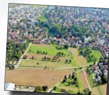
Luftbild „Lammtal“ aus Richtung Westen

Bürgermeisteramt Gärtringen, Tel. 07034/923-0; e-mail: info@gaertringen.de oder zum Herunterladen unter www.gaertringen.de Grundbuchratschreiber Herr Thüroff, Tel. 07034/923-114 bzw. 923-115