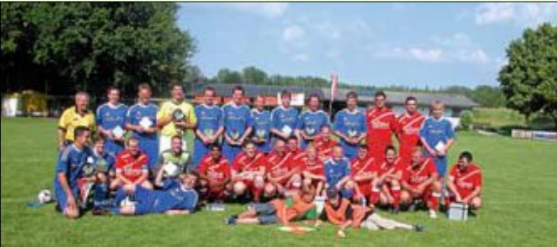
Fußballmannschaften aus Rohrau und Gärtringen