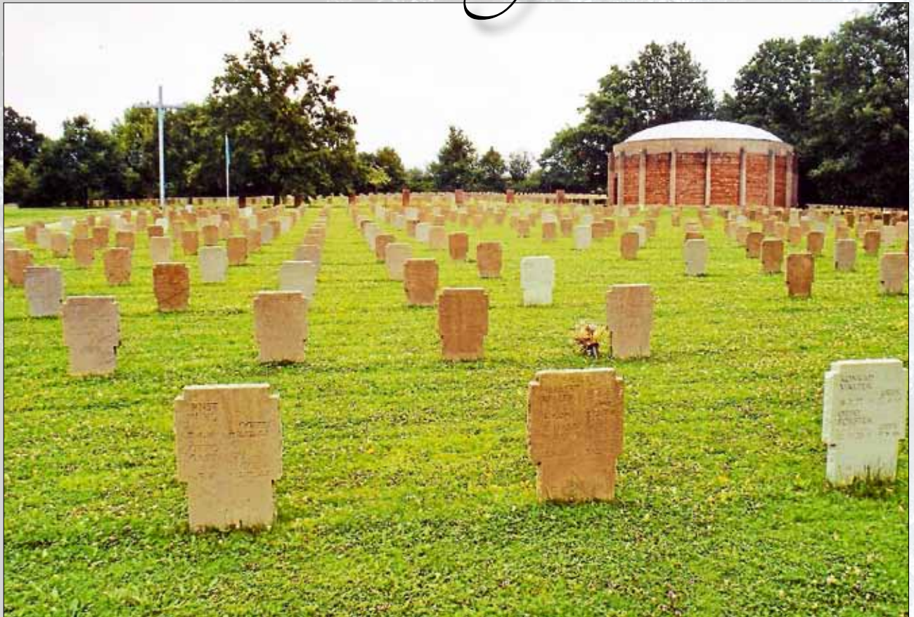
Soldatenfriedhof in Niederbronn

Die Feier findet in Gärtringen am Sonntag, den 13. November 2016 gegen 11.15 Uhr beim Gefallenen-Ehrenmal an der Evangelischen Kirche statt.