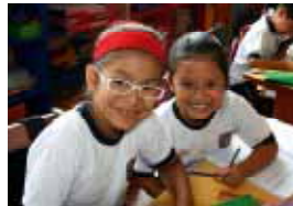
Veranstalter: Ev. Kirchengemeinde Rohrau

Das Kinderwerk Lima (Peru) betreibt u.a. Schulen und ein Kinderspeisungsprogramm.