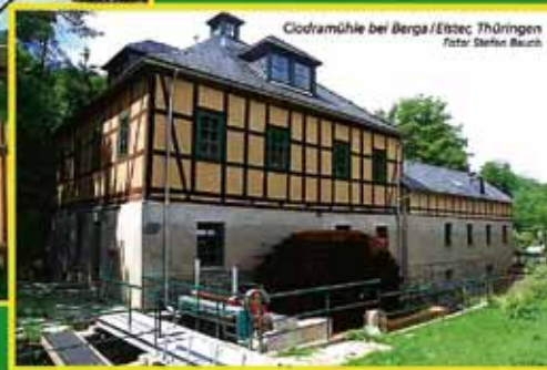
Godramühle bei Berga / Eitze, Thüringen