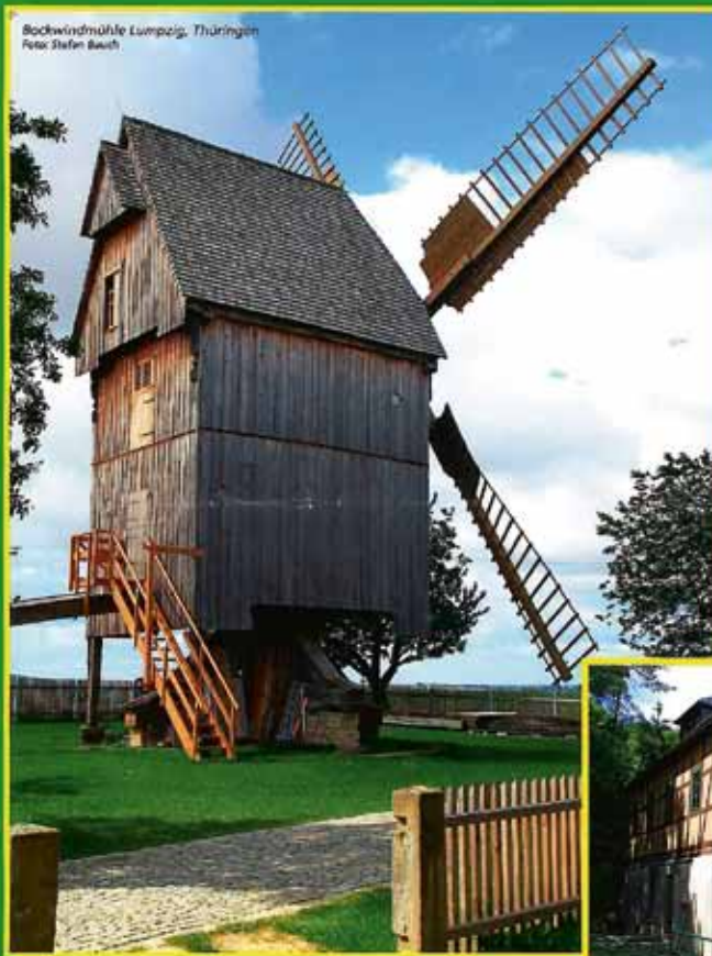
Bockwindmühle Lempzig, Thüringen