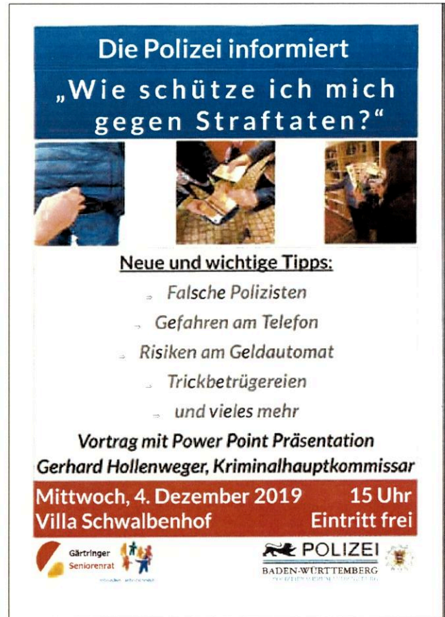
Plakat: Gärtringer Seniorenrat