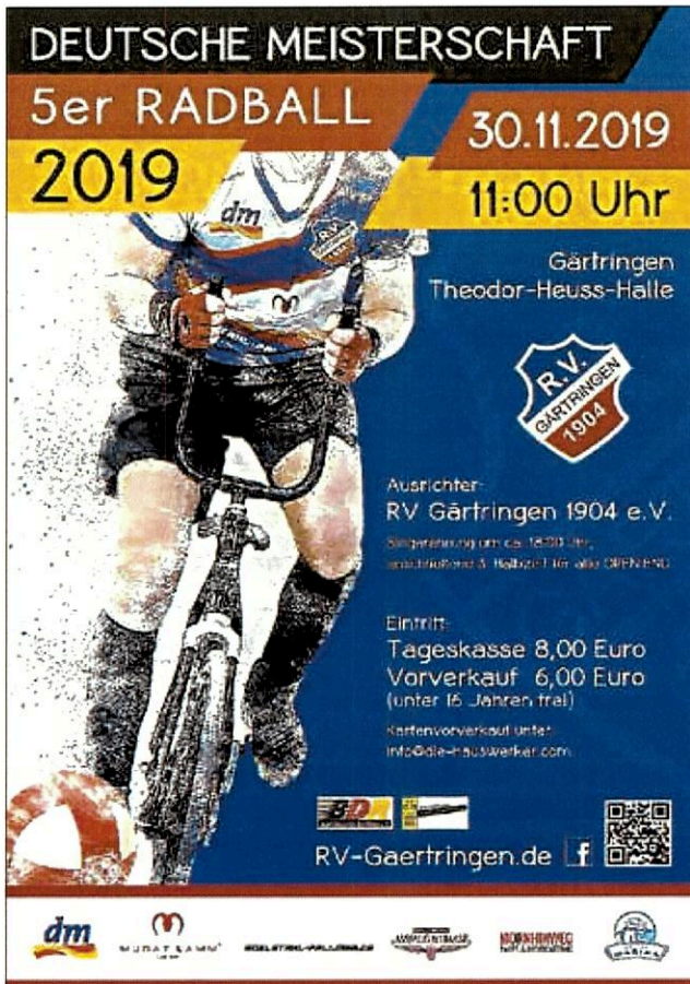
Plakat: RV Gärtringen