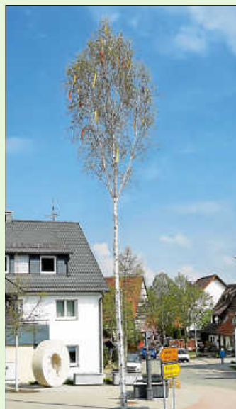
Maibaum in Rohrau

Wir bedanken uns herzlich bei den Kameradinnen und Kameraden dafür!