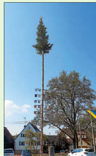
Maibaum in Gärtringen vor dem Rathaus